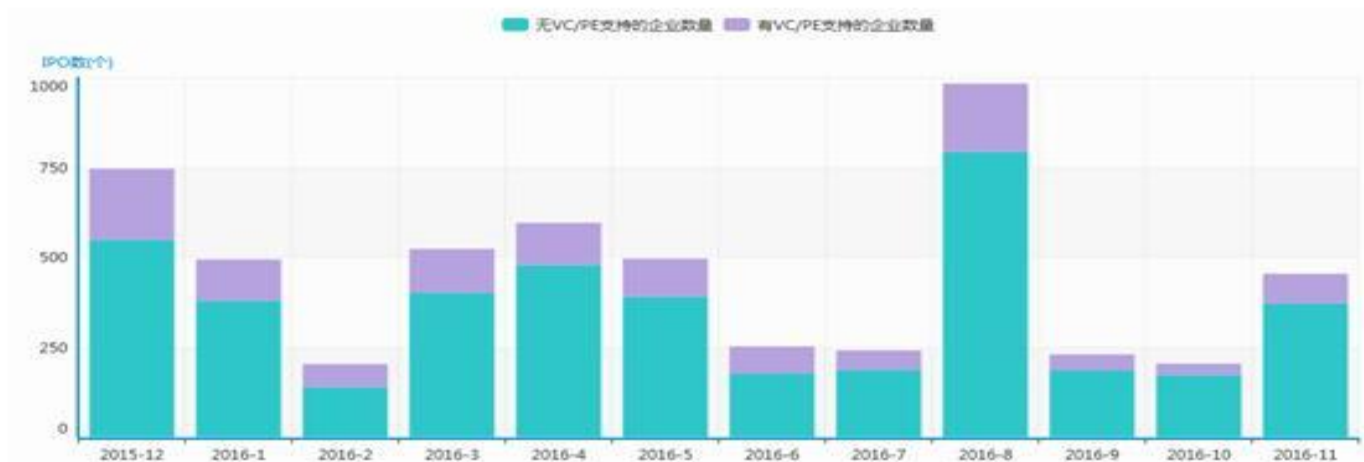
图1 新三板挂牌企业月度走势

根据清科旗下私募通统计，截止2016年11月新三板挂牌企业数量达到9764家，其中基础层企业8811家，创新层953家；采用协议转让方式的8116家，做市转让的企业1648家，较上月增加2家。11月新增挂牌企业共454家，其中共有82家企业获得VC/PE支持，占比18.06%。11月份企业挂牌步伐较上两月有所提升，环比增长122.55%。11月21日，股转公司发布公告，由于挂牌公司普通股票首两位代码为83开头的证券代码号段已全部分配完毕，今后将开始使用87开头的证券代码号段。按照目前的企业挂牌速度，12月份新三板挂牌企业总数有望破万。