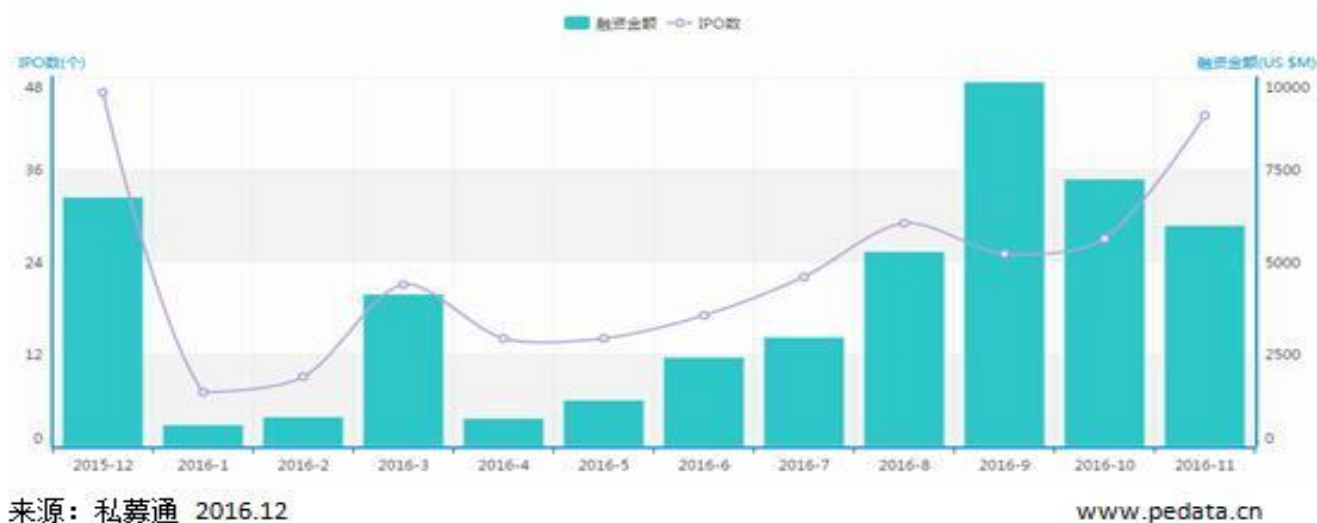
图1 IPO数量和融资金额月度走势

根据清科集团旗下私募通数据显示，2016年11月全球共有43家中国企业完成IPO，IPO数量环比增加59.26%，同比增加330.00%。中企IPO总融资额为59.70亿美元，融资额环比减少17.38%，同比增加157.75%。本月完成IPO的中企涉及16个一级行业，登陆4个交易市场，中企IPO平均融资额为1.39亿美元，单笔最高融资额16.38亿美元，最低融资额1128.12万美元。43家IPO企业中30家企业有VC/PE支持，占比69.77%。本月金额最大的三起IPO案例为：上海银行上市（16.38亿美元），步长制药上市（5.99亿美元），海兴电力上市（3.39亿美元）。此外，2016年11月1日，百胜中国（证券代码：YUMC）完成从Yum! Brands（证券代码：YUM）的分拆，正式独立在纽交所上市交易，不计入本月统计。